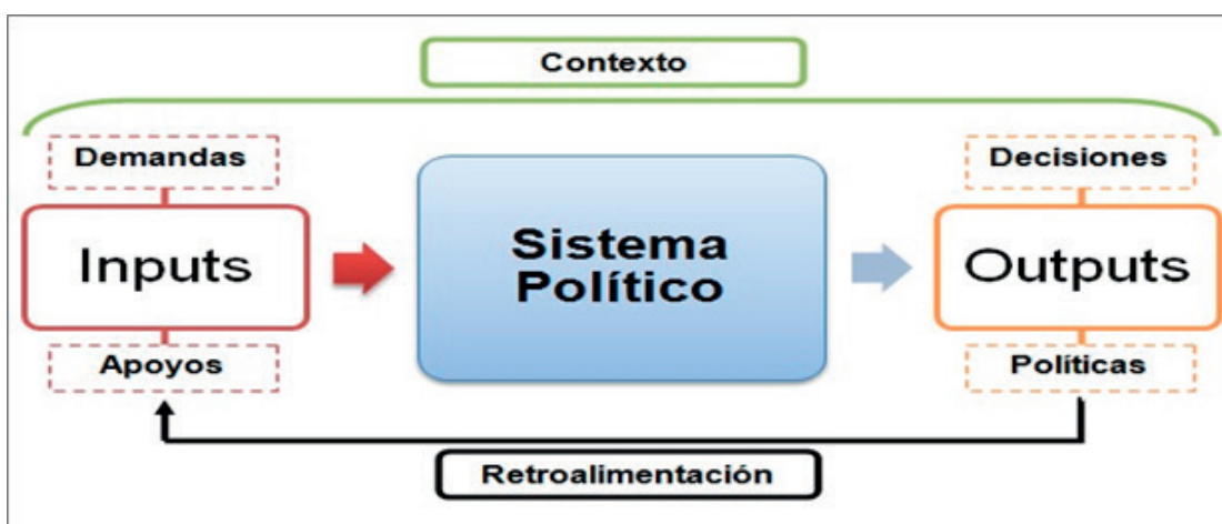
Figura 2: Sistema político de David Easton. Elaboración propia.

La figura 2 permite ilustrar cómo la cultura política se entronca en el sistema político de una sociedad, «encapsulando así tanto la experiencia histórica general de la sociedad como las experiencias privadas y personales de cada ciudadano como miembro de la sociedad» 17 . Refleja valores estables 18 y tiende a permanecer en el tiempo, lo que no implica, empero, que no pueda modificarse de manera gradual.