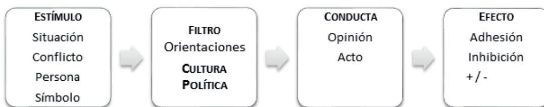
Figura 1: El comportamiento político explicado a partir de la cultura política. Elaboración propia adaptada de Vallès 11

individuos receptores. Nótese que dicho efecto puede ser expresa o implícitamente a favor de ese objeto o en contra de él, donde la no-acción es también una posición. Destacan también los propios Almond y Verba 9 que la cultura se refiere a «orientaciones específicamente políticas» 10 .